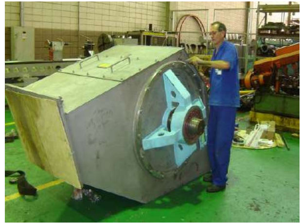
RASPADOR DO DIGESTOR – PRÉ-MONTAGEM Cliente : ARACRUZ