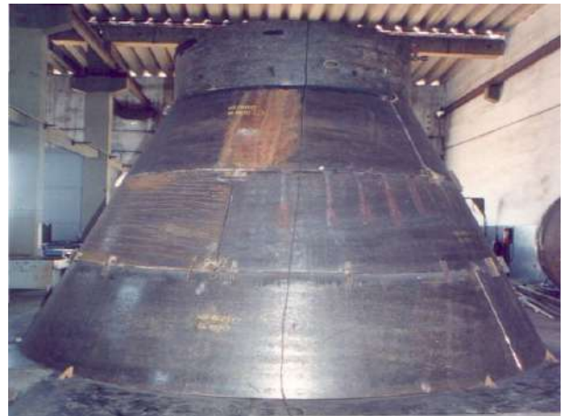
CONE DA RETORTA – PETROBRAS SIX