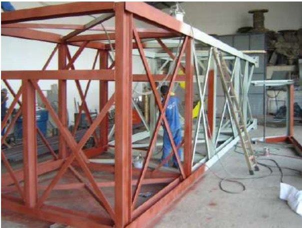
ESTRUTURAS Cliente : VCP