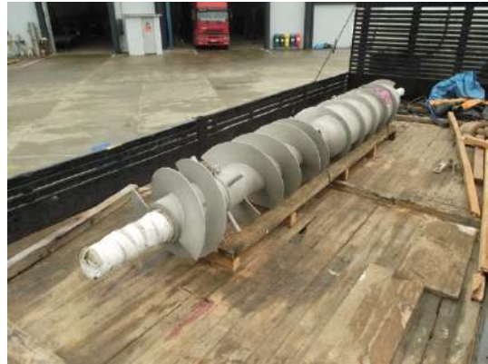
ROSCA DE DESCARGA Cliente : TAFISA