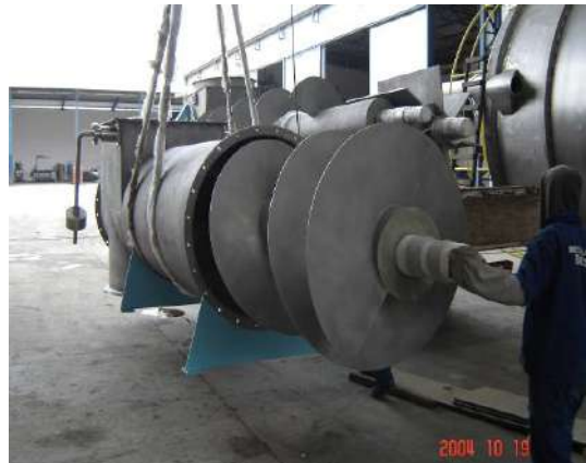
ROSCA DE ALIMENTAÇÃO DO SILO DE CAVACO Cliente : VCP