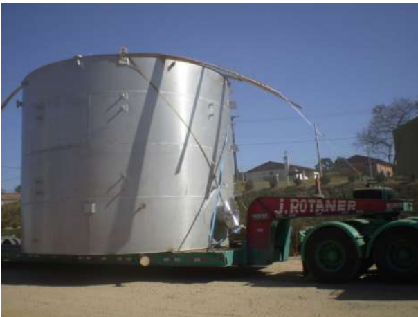
TANQUE DE CETANO PETROBRÁS / REPAR