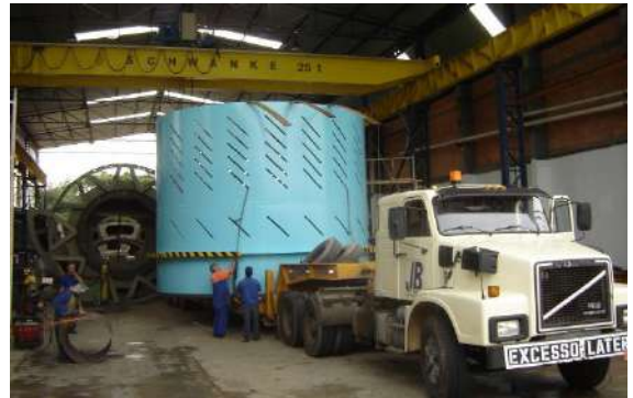
DESCASCADOR DE TORAS Cliente : VCP