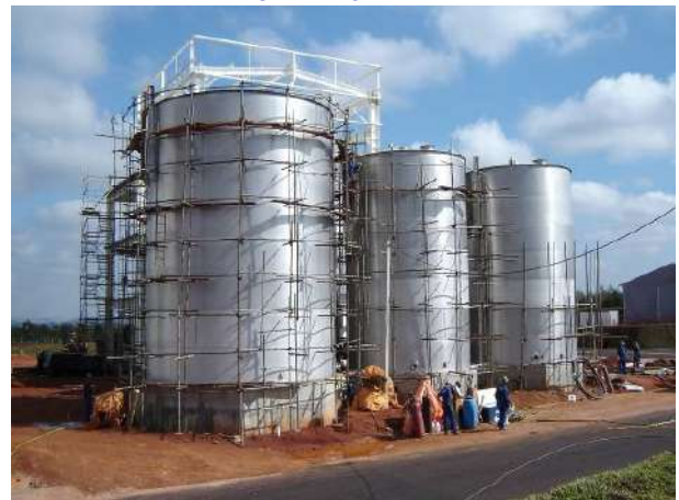
TANQUES – FABRICAÇÃO E MONTAGEM Cliente : OMYA