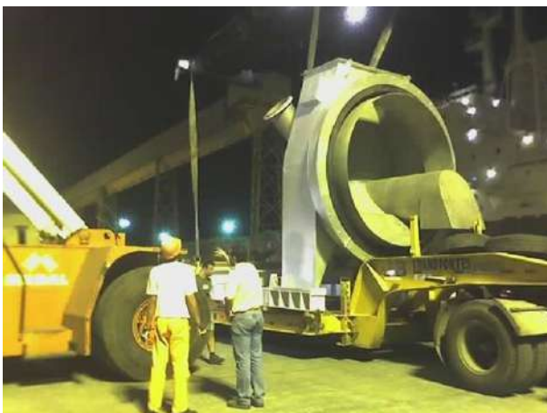
ALIMENTADOR DE CAL – “FEED HEAD” DESCARREGAMENTO NO PORTO