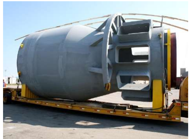
RESFRIADOR DE CAL – “KILN SHELL” PARTE INTERNA EM AÇO CARBONO