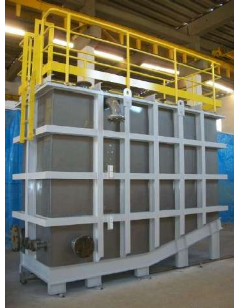
CIP TANK Cliente : IESA