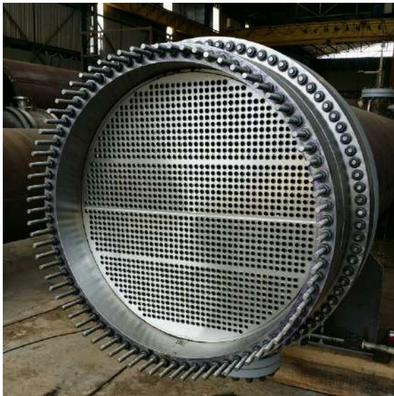
TESTE HIDROSTÁTICO LADO CASCO PETROBRÁS / REPLAN