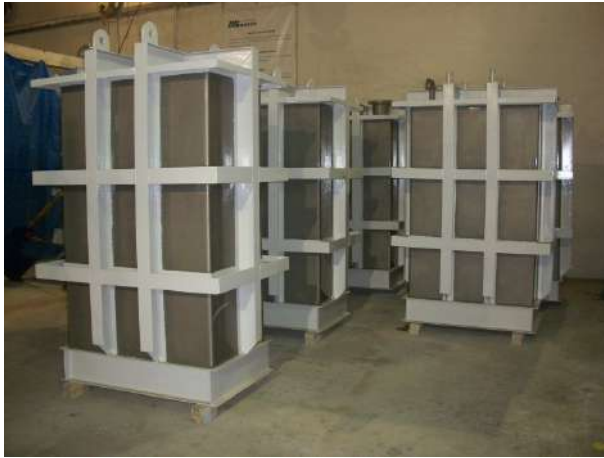
TOTE TANKS Cliente : IESA