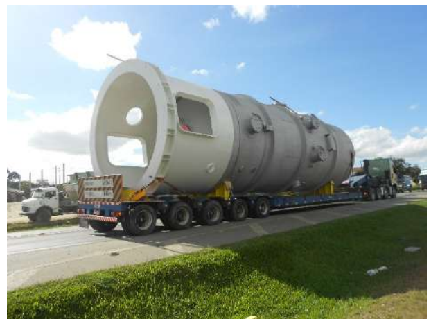
X-FILTER – “LIMEGREEN”