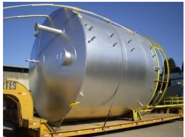
TANQUE DE DEA PETROBRAS REPAR