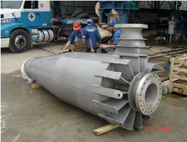
CICLONE - RLAM