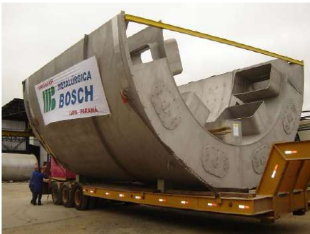
RESFRIADOR DE CAL – “SECTOR COOLER” SEGMENTO PARCIAL (180°) EM INOX 304L