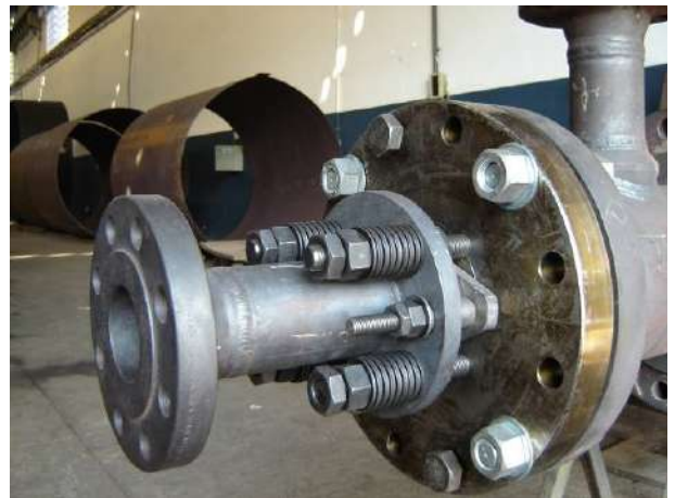
CONE DO RISER COM DISPERSORES SAIDA DA MIB – CONJUNTO SOBRE A CARRETA