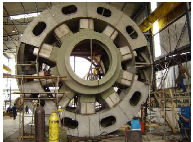
RESFRIADOR DE CAL – “SECTOR COOLER” PARTE INTERNA EM AÇO CARBONO E EXTERNA EM INOX 304L – PRÉ-MONTAGEM