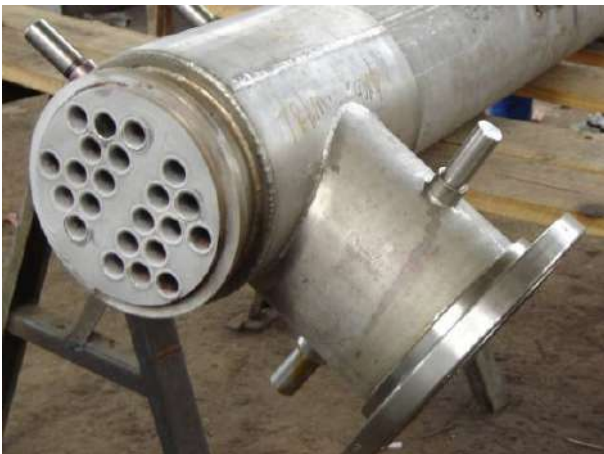
TROCADOR DE CALOR Cliente : VCP