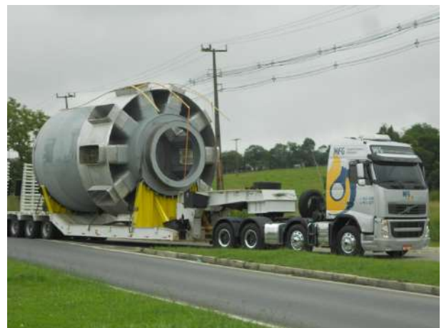
RESFRIADOR DE CAL – “KILN SHELL” PARTE INTERNA EM AÇO CARBONO