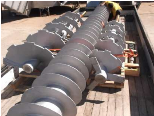
ROSCAS FABRICADAS COM HÉLICES ESTAMPADAS