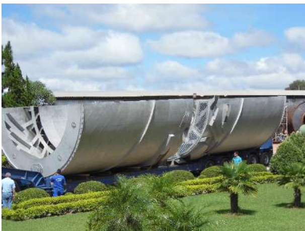
RESFRIADOR DE CAL – “SECTOR COOLER” SEGMENTO PARCIAL (180°) EM INOX 304L