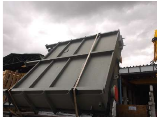
RESFRIADOR DE FLUIDO TÉRMICO Cliente : SEPAC