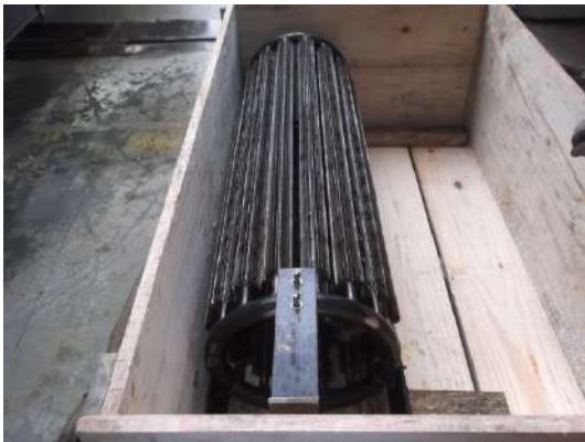
SERPENTINA DE AQUECIMENTO Cliente : MBAC FERTILIZANTES