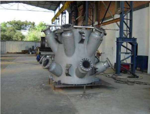
CONE DO RISER – “RELAM”