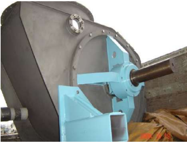
BRAÇO DO RASPADOR DO DIGESTOR Cliente : ARACRUZ