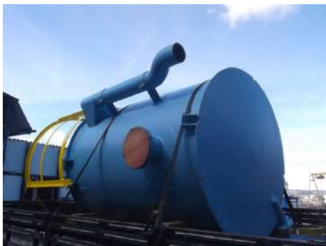
TANQUE SEPARADOR Cliente : RIGESA