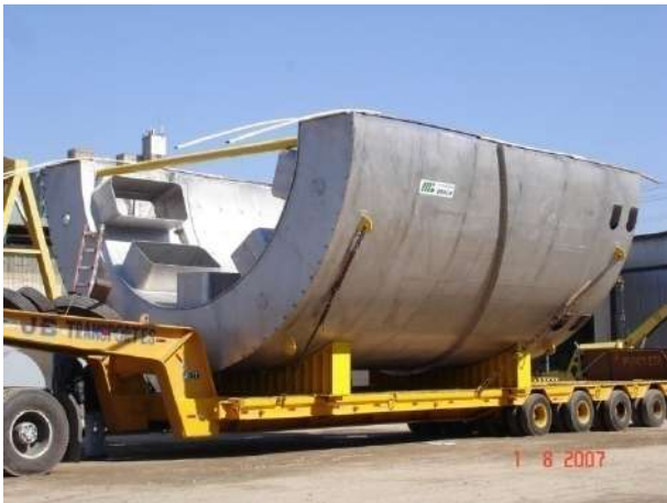
RESFRIADOR DE CAL – “SECTOR COOLER” SEGMENTO PARCIAL (180°) EM INOX 304L