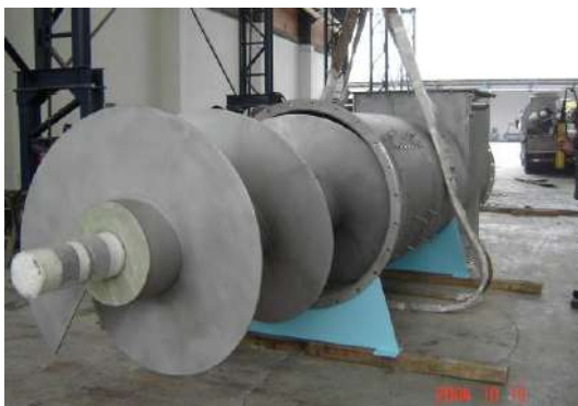
ROSCA DO SILO Cliente : VCP