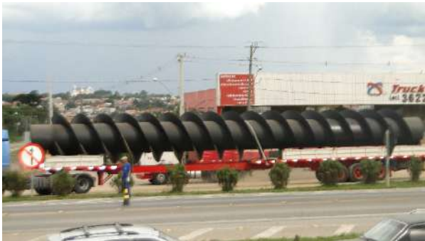
ROSCA BOMBA PARAFUSO Ø2.800 X 23.000 mm comprimento Cliente : HAZTEC