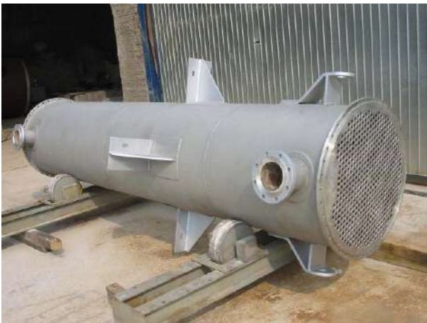
TROCADOR DE CALOR Cliente : LWARCEL