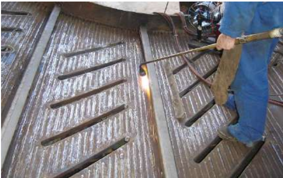
DESCASCADOR DE TORAS ( VISTA INTERNA ) Cliente : VCP