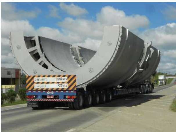
RESFRIADOR DE CAL – “SECTOR COOLER” SEGMENTO PARCIAL (180°) EM INOX 304L